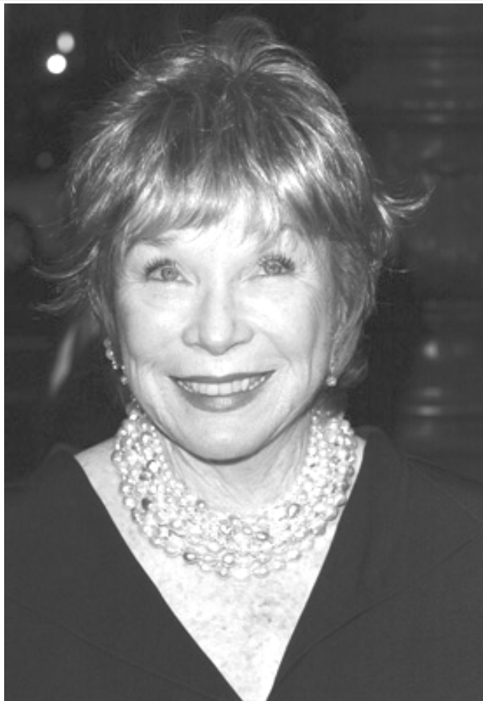
Американската актриса Шърли Маклейн е един от идеолозите и водещо рекламно лице на Ню Ейдж движението

е коле-баел дали да из-върви пътя си до-край, но и другите е увличал след себе си, казвайки: “Ако Бог е за нас, кой ще е против нас?” (Рим. 8:31). И още: “Аз имам дълг към елини и варвари, към мъдреци и невежи” (Рим. 1:14). Чрез личния си живот, както и чрез активна писателска, преподавателска и лекторска дейност, с Божията помощ, бихме могли да помагаме много на обществото ни като му преподаваме чистата евангелска истина и като го предпазваме от увличане по всяко “ново” учение, чуждо на православно-славния дух. Защото “има някои,