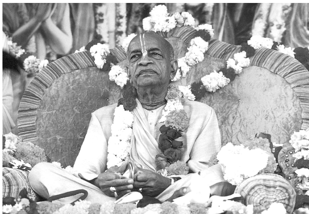
Бхактиведанта Свами Прабхупада или Шри Чайтаня Махапрабху (1896-1977) – основателят на Международното общество за Кришна съзнание