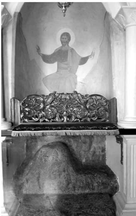
Камъкът на планината на изкушенията над Йерихон, където Исус Христос се е молил и постил 40 дни и 40 нощи

Да стоим на пост пред Господа означава да внимаваме върху себе си, да съблюдаваме Божиите заповеди и да виждаме в изпълнението им най-голямото блаженство, спрямо което всяко наше лично желание или предпочитание бледнее. Нека още в началото на нашите размишления за поста се запитаме: „Можем ли да дарим на Бога нещо, което е само наше и не идва от Него?” Разбира се, че не. Защото и тялото ни, и душата ни, и вложените в нас таланти, и ближните ни, и природните блага около нас са все Негово дело и не биха могли да възникнат, ако Всеблагият Творец не бе създал духовния и физическия свят с техния богат и многолик потенциал. Следователно и добрите ни дела са наш дълг пред добрия Бог, а не наша заслуга, защото Какъвто е Първообразът - Бог, такъв трябва да е и образът Божий – човекът. „И сътвори Бог човека по Свой образ, по Божий образ го сътвори; мъж и жена ги сътвори” (Бит. 1:27) – значи ние сме богообразни хора по вложената в нас словесност, разумност, вяра, творчески способности, умение за пълноценно общуване и даряване на безкористна любов.