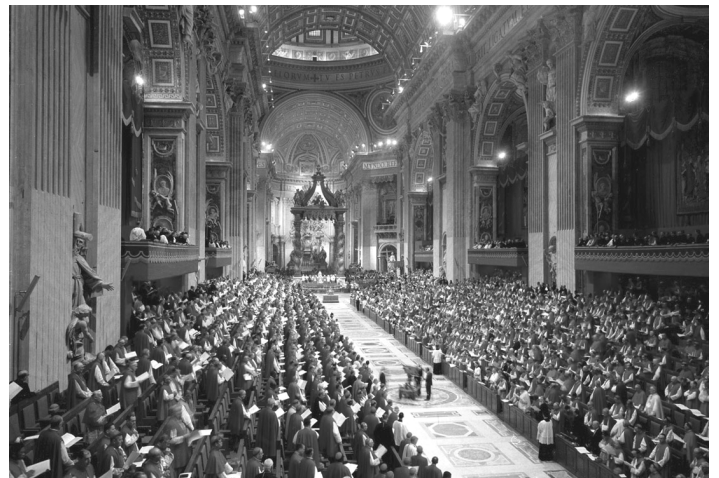
II Ватикански събор в базиликата „Св. Петър” - Рим

В старо време архиереите на Вселенската патриаршия използвали каноничния чин при приемане на някои инославни в Православната църква, като прилагали правилото на строгостта (акривия) или снизхождението (икономия). Правели разлика, че едно е дали извън Църквата има тайнства - каквито няма - а друго е как ние приемаме някой инославен в Църквата. Строго погледнато, извън Църквата няма тайнства, но по снизхождение приемаме някого с миропомазване или писмено отричане от ереста и изповядване на православната вяра, ако кръщението е извършено в името на Троицния Бог, изповядван православно, и с трикратно потапяне във водата. Това ни удовлетворява. Мнението на някои, които искат да превърнат снизхождението от временно спиране на строгостта в постоянна ситуация, е недопустимо.